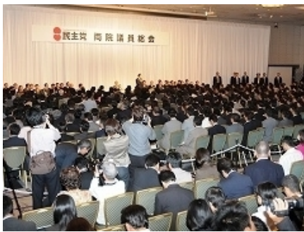
9月15日、総選挙後の国会開会前日の 民主党両院議員総会。人、ヒト、ひと!!