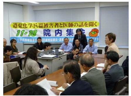
11月18日、遺棄化学兵器被害者救済 集会に参加。中国チチハル、茨城県神 栖の毒ガス被害者のお話を伺いました。