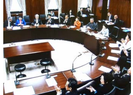
11月12日、環境委員会での大臣所信。 理事席に座っての委員会は緊張します!