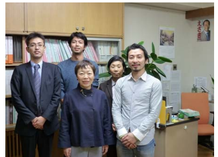
12月4日、臨時国会最終日。福岡の仲 間が激励に来てくれました。