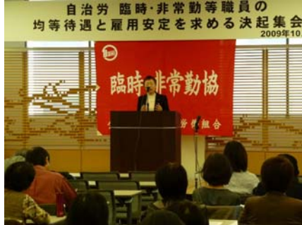
10月10日、臨時・非常勤等職員の均 等待遇と安定雇用を求める決起集会。 政策実現の要望書をいただきました。