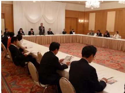
9月17日、自治労協力国会議員団会 議に参加。政権交代で議員団も顔ぶれ が増え、頼もしい限りです。