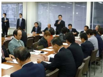
11月5日、田島環境副大臣主催の政 策会議では、小沢環境相がご挨拶。