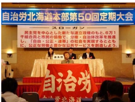
9月29日、自治労北海道本部定期大 会でご挨拶。熱心な議論の最中にも関 わらず、お時間を頂戴して恐縮です。