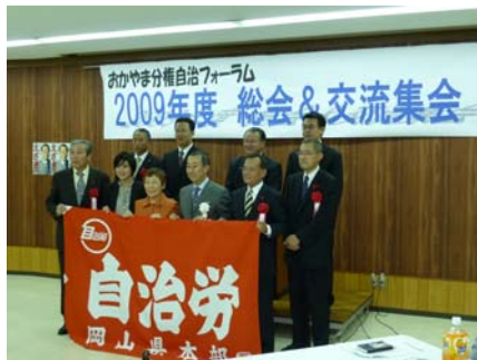
10月31日、岡山分権自治フォーラムに 行ってきました。政権交代後の総会とあ って、会場は熱気に包まれていました。